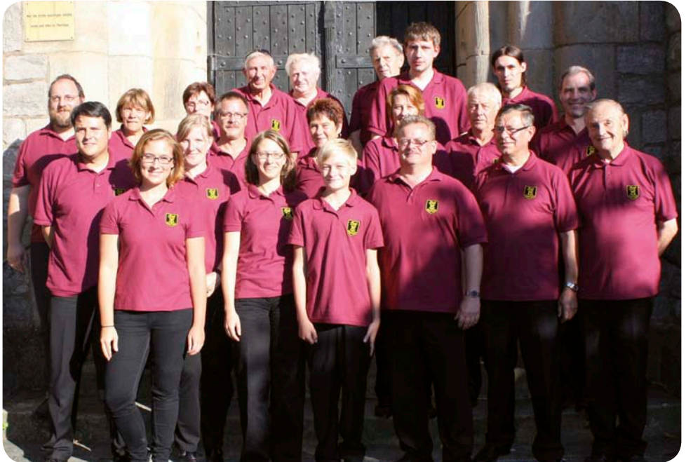
Musikverein Bennigsen e.V. (2012)

Nachdem die Musiker weniger wurden und somit die Orchesterbesetzung schwieriger, haben die Musiker des Musikvereins Bennigsen und des Musikzugs der Freiwilligen Feuerwehr Bennigsen 2014 fusioniert .