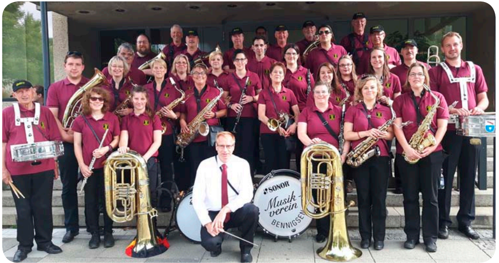
Musikverein Bennigsen e.V., Ausmarsch Hannover (Sommer 2016)