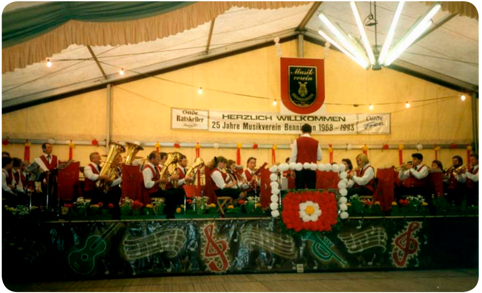
25 Jahre Musikverein Bennisgen e.V., Ausrichter Volksfest Bennisgen (1993)

War der Musikverein zu seiner Gründung ein reiner Männerverein , so ist im Laufe seiner Geschichte auch hier der Wandel eingetreten. Die Weiblichkeit hat ihren Einzug gehalten. Heute hat der Frauenanteil im Musikverein Bennisgen die Mehrheit .