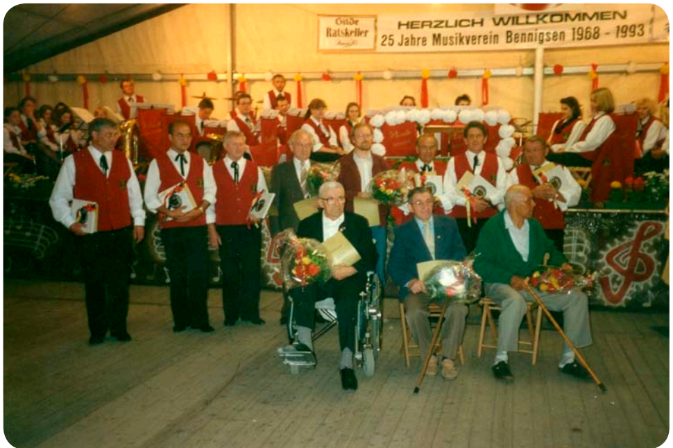
25 Jahre Musikverein Bennigsen e.V., Ehrungen (1993)

Der erste Meilenstein war das 25-jährige Jubiläum , welches 1993 mit dem Ausrichten des Bennigser Volksfestes gefeiert wurde.