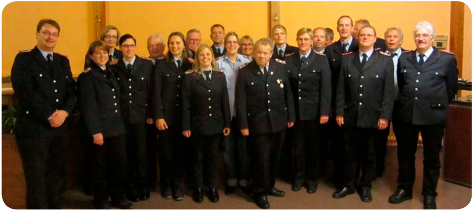
Musikzug der Freiwilligen Feuerwehr Bennisgen (2013)