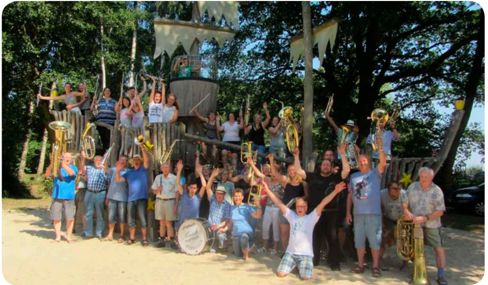
Jugendherberge Mardorf am Steinhuder Meer (Sommer 2016)

Seitdem findet in jedem Jahr ein Konzert statt. Die Konzerte werden unter anderem jeweils an einem musikalischen Wochenende in einer Jugendherberge in der näheren Umgebung vorbereitet. An diesen Tagen wird viel musikalisch gearbeitet, aber auch der Spaß kommt nicht zu kurz.