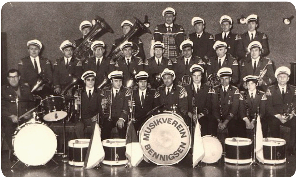
1. Foto als Musikverein Bennigsen e.V. (1968)

Seit dem 01.05.1968 ist nun der Musikverein wieder selbstständig und seit dem 17.04.1984 im Vereinsregister der Stadt Springe eingetragen und führt nun den Zusatz e.V. in seinem Namen.