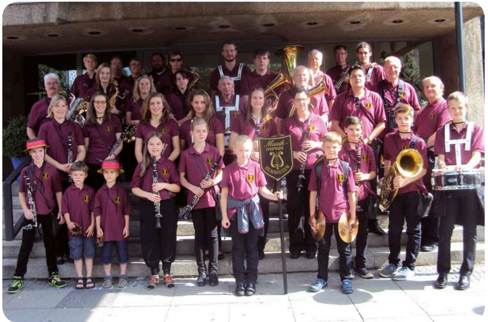
Blasorchester Musikverein Bennigsen e.V., Schützenfest Hannover (2014)