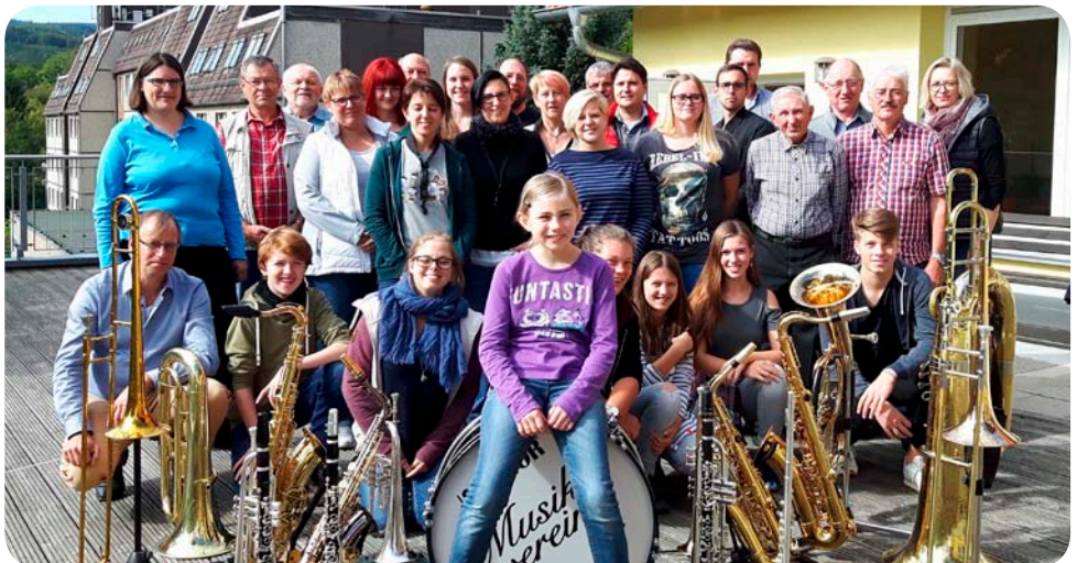
Musikverein Bennigsen e.V., Musikfreizeit Wernigerode (Herbst 2017)